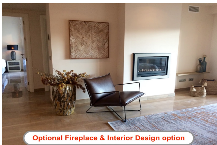
Optional Fireplace & Interior Design option